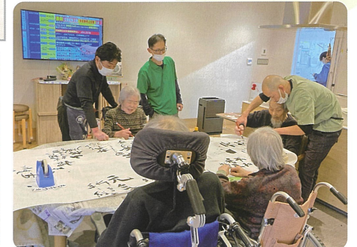
「私は元気って書くわ」、「私は自分の名前を書く」と言われ、机いっぱいの和紙を囲み、皆様が書きたいことを書かれていました。