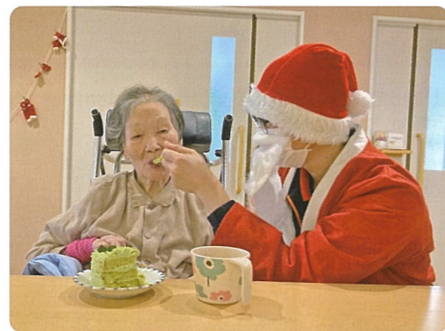
「ジングルベル、ジングルベル、鈴が鳴る〜」とサンタと一緒に歌いました。その後、クリスマスケーキを食べました。