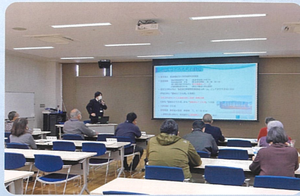
11月14日、湯梨浜町民生委員の皆様がはごろもホールをご利用の際、当苑の紹介をしました。