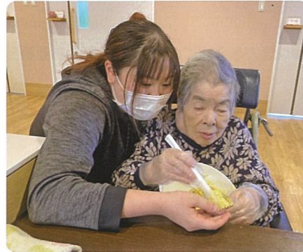
「芋のええ匂いがするなあ〜、こぼさんように持っといいな」と、職員と一緒に作られました。