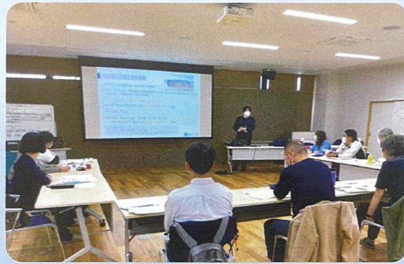
10月16日、鳥取県DWAT先遣隊・コーディネーター研修の際、はごろもホールの避難所としての役割を紹介しました。