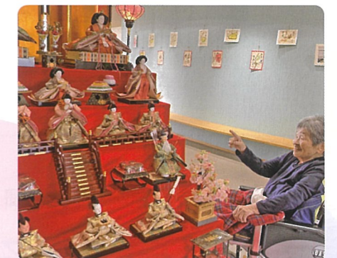
「これ見てきれいな着物だわ。懐かしいなあ」と、指をさしながらお雛様を眺めておられました。