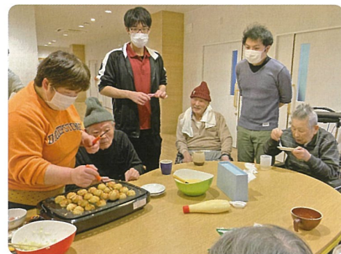
たこ焼きの他にビールを振る舞い、「できたては美味いわ。もう一つちょうだい」と言われ、楽しまれていました。