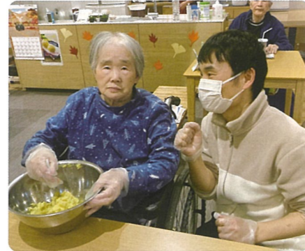
御家族からいただいた芋で茶巾作りを行いました。甘みのある芋で大変好評でした。