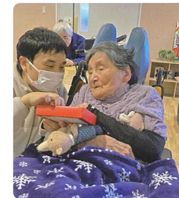
はごろも神社の鳥居へ皆さまが拝みに行かれました。くじ引きや甘酒を飲んだり、絵馬へ願いを書いて、職員も一緒になって楽しみました。