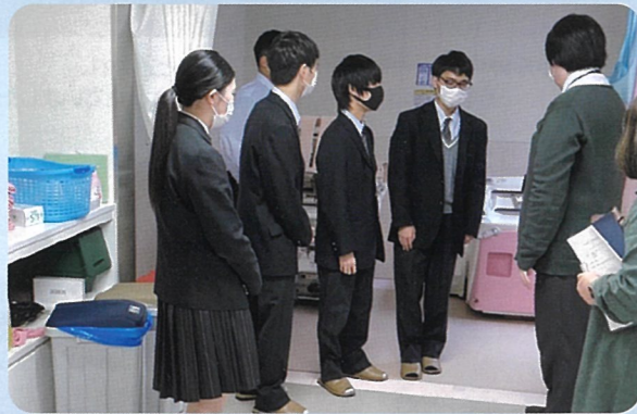
11月20日、倉吉北高等学校生が来られ、福祉機材に興味深そうに見学されていました。