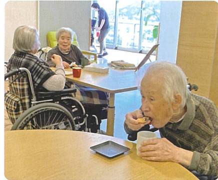
「自分で作ったものを食べるのは美味しいわ」と言われ、おかわりをされていました。