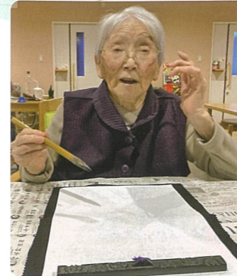
「なに書こうかな?」と、悩んだ末大きく「おめでとう」と書かれました。