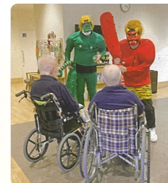
でっかい鬼っ子と鉢合わせ「わ〜なんちゅう強うそだなあ」と言われ、ビックリしたけど仲良くなりました。