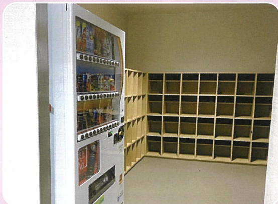
はごろもホール玄関口に自動販売機を設置しました。会議・研修でお越しの際は、是非ご利用ください。

地域での介護予防や認知症予防、栄養管理等の講師依頼の際は、お気軽にお電話、またはホームページからご連絡ください。