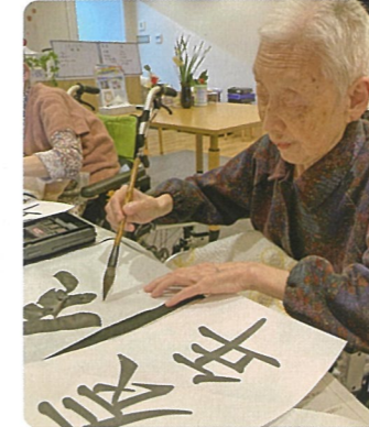
「お手本をよく見て書けえ」と、言われ真剣に取り組まれていました。