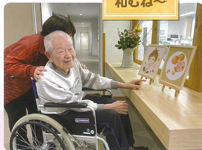
当苑職員の作品を展示しています。季節にちなんだ絵を見て「上手にしとんなるなあ〜本物みたいだわ」と、じっくりと鑑賞されていました。