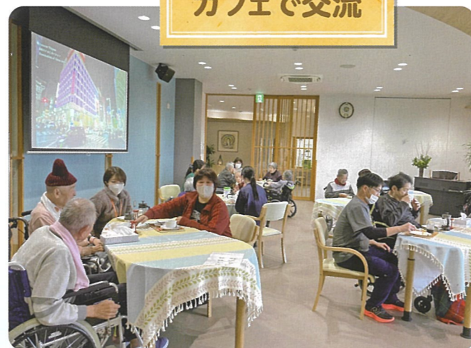
12月14, 15日、鳥取県新規採用職員体験研修で2名の方が来られました。一緒にカフェでお茶して、会話を弾みました。