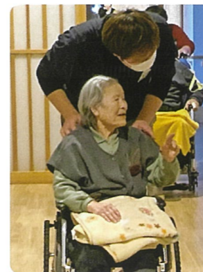
1月12日、火災想定避難訓練を実施しました。入居者の方へ説明し、一緒に向かいのユニットへ水平避難をしました。終了後、消化器使用の訓練を行い、手順を確認しました。