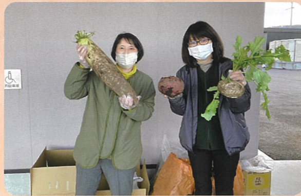
2月9日、入居者のご家族様より、家で作られた新鮮な野菜をいただきました。愛情たっぷりとても美味しかったです。