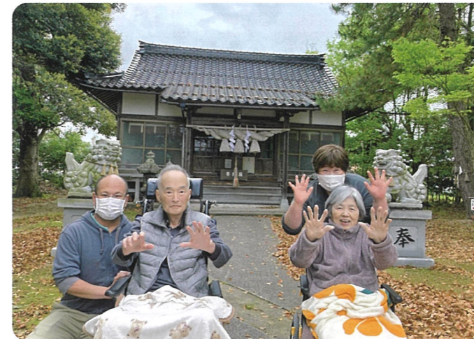
「久しぶりのお出掛けで気持ちいいなあ」と、近くのはわい温泉にある宮本神社へ行きました