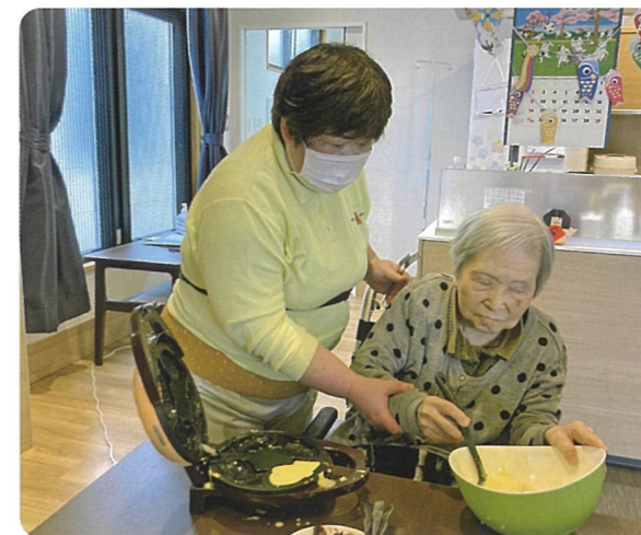
「たい焼きを自分で作れて嬉しいですわ〜」と、言われ楽しんでおられました