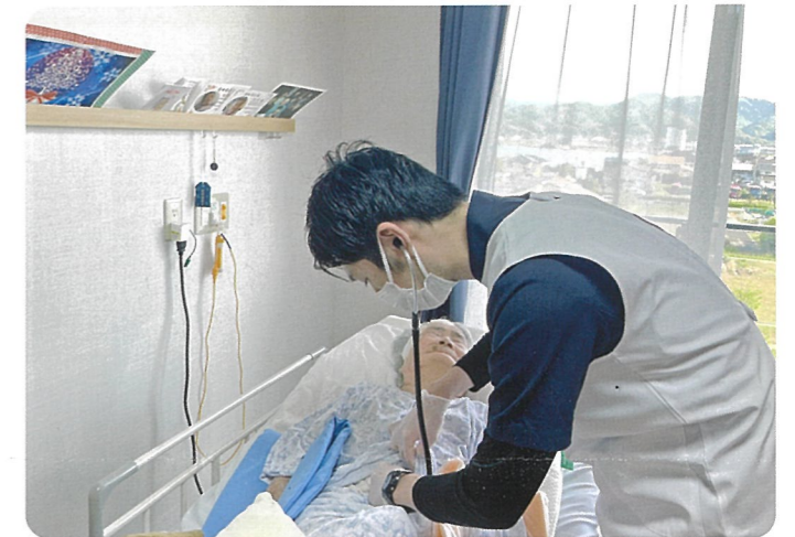
看護師が会話をしながら表情をみて、体調観察をしています

体調の変化があった際にはその都度ご家族に連絡をさせていただきますので、よろしくをお願いします。