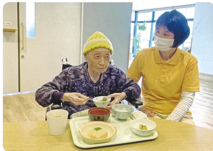
管理栄養士が一人一人に合った食事形態等を考え、提供しています