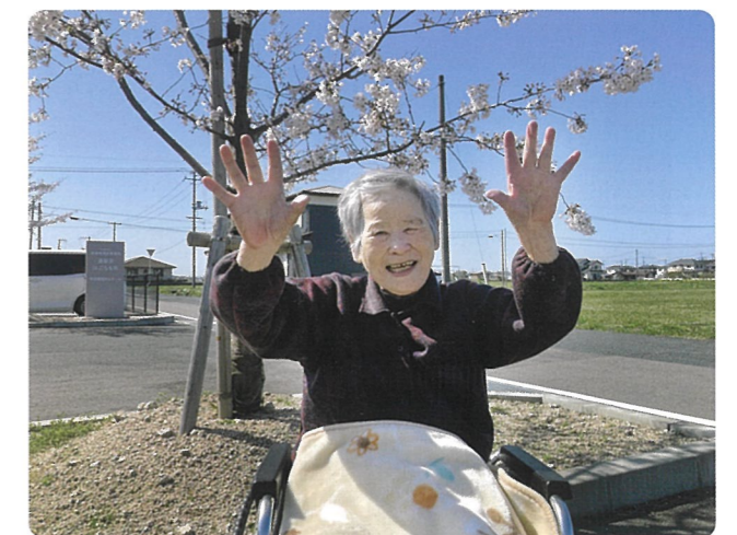
「今年は桜が咲くのが早いな〜、まだつぼみもあるで」と、教えてくださいました