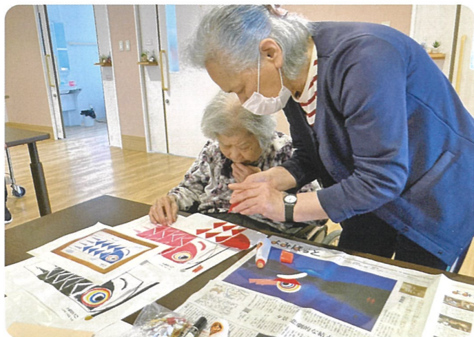
創作クラブで季節にちなんだ色鮮やかないのぼりを一緒に作りました

月に1回各ユニットでリハビリ体操や創作クラブを開催し参加を通して体を動かし、作業を通じて達成感や他入居者との関わりを持っていただけるよう支援しています。