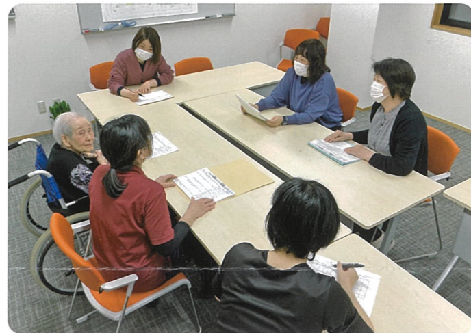
カンファレンスで入居者の方を交えて話し合いをしています

各部門と連携し、職員がより働きやすい環境を整え、入居者の皆様と職員全員が笑顔で過ごすことのできる施設、また、地域の皆様にも愛される施設づくりを目指し日々の業務に当たっていきます。