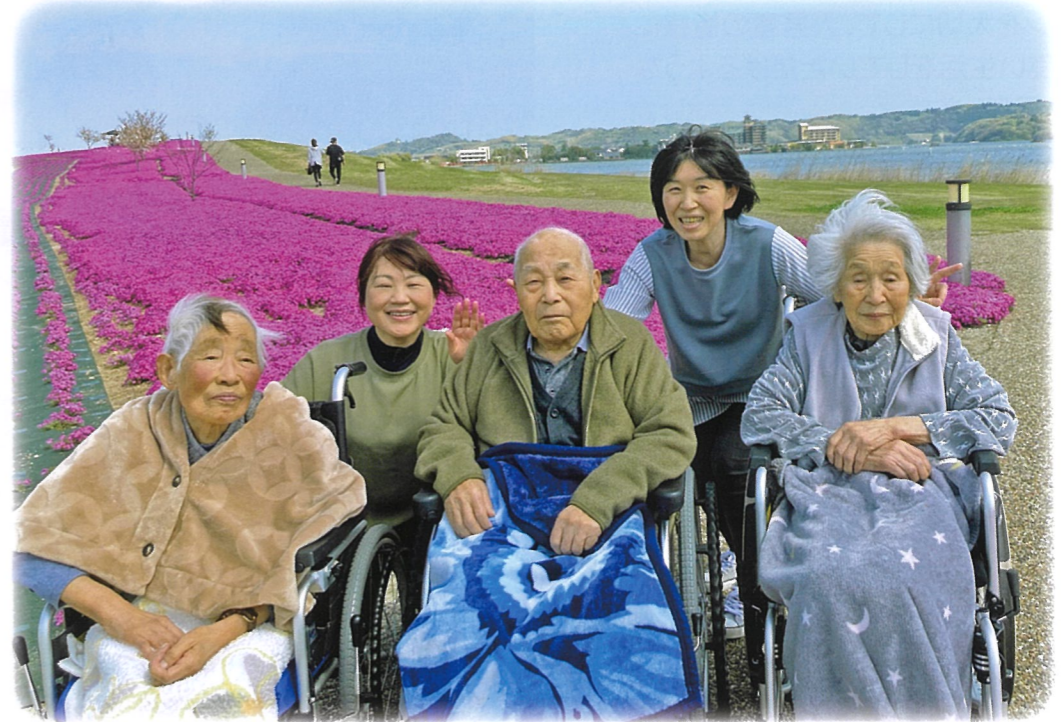
「芝桜や東郷池が見えてよかったわ〜」久しぶりのドライブ外出を楽しめました（めぐみの湯公園にて）

一人ひとりのこれまでの暮らしや歴史を大切に、喜びと安らぎのある暮らしを支えとともに地域社会に貢献します。