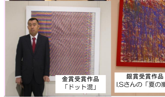
金賞受賞作品 「ドット混」