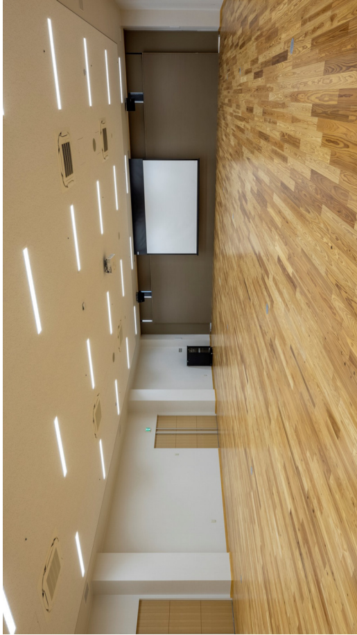
↑ ホール ホワイエ ↓