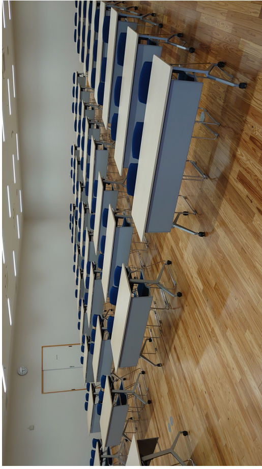
↑ ホール ホワイエ 椅子を配置しています (通常は机・椅子を配置していません) ↓