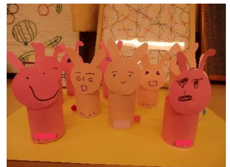
元年度やまと園祭の作品より