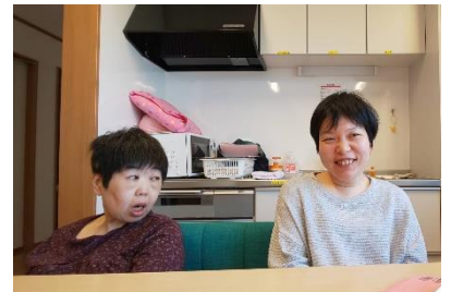
リビングにてガールズトーク