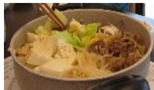
この日のメニューはすき焼きでした♡ 準備を手伝っていただきました🍗