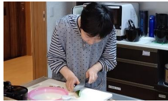
包丁を持つ時は真剣そのもの🔪