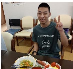
誕生日ディナー🎂 Happy Birthday!!

ほんの小さな意思決定ですが、自分で決める事の喜びを感じていただいています。この様な小さな喜びを生活の中に沢山散りばめていける事が私たち職員の願いです。