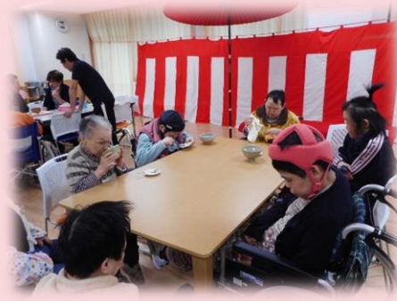
皆さん楽しんでいらっしゃいました