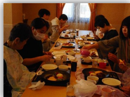
レストランでの風景