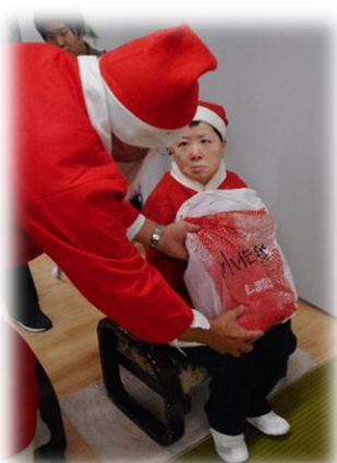
サンタのプレゼント